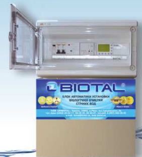
Блок автоматики установки BIOTAL®