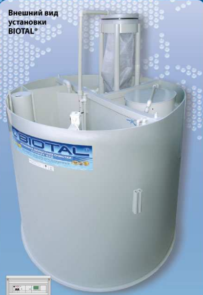
Внешний вид установки BIOTAL®

Золотая медаль международной выставки новой техники и технологий в Женеве, 2006 г.